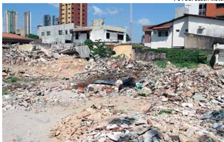
Terreno na Avenida Ruy Carneiro acumula lixo e outros entulhos