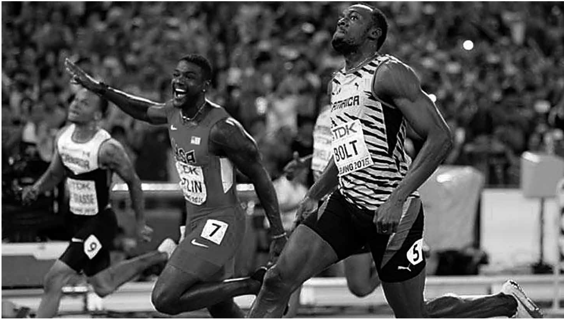
Justin Gatlin (C) já competiu em algumas vezes com o jamaicano Usain Bolt, mas ainda não venceu, traçando como meta principal derrotá-lo nas Olimpíadas deste ano

Com sete medalhas de ouro, o Quênia liderou o quadro de medalhas do Mundial de atletismo de 2015, disputado em Pequim. Entretanto, desde 2011, mais de 40 atletas do País foram pegos em exames antidoping - em janeiro de 2016, 18 estavam suspensos.