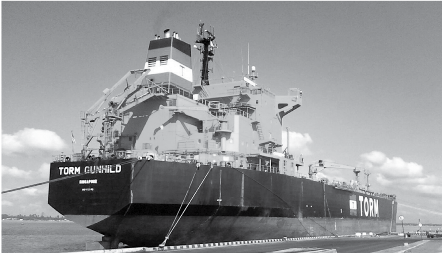
Navio petroleiro Torm Gunhild - 181 metros -, com bandeira de Cingapura, quando descarregava no terminal 7.000 toneladas de gasolina

"Neste sábado está prevista a chegada do navio Macey, vindo dos Estados Unidos com 34,9 mil toneladas de petcoke. Da Argentina