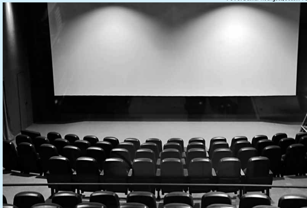
O Cine Banguê retomará as atividades em espaço moderno e terá capacidade para 120 pessoas