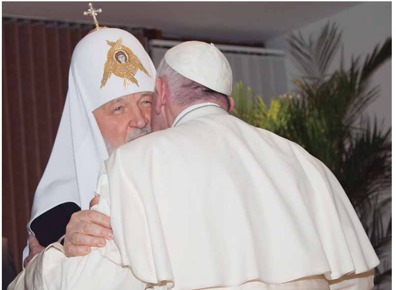
O papa Francisco e Kirill, patriarca russo, se cumprimentam durante encontro no Aeroporto José Martí, em Havana, Cuba

Um dos destaques da viagem deve ser sua missa de encerramento, na tarde de 17 de fevereiro, em Ciudad Juárez. Na ocasião, ele deve expressar sua solidariedade aos migrantes que tentam cruzar a fronteira com os Estados Unidos. A expectativa é de que 200 mil mexicanos e 50 mil texanos se reúnam para a bênção do papa.