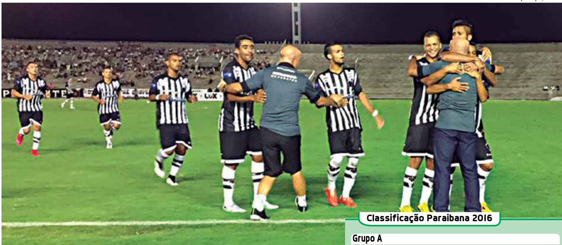
O Botafogo ainda segue invicto no Campeonato Paraibano com duas vitórias e dois empates

Com uma vitória de 3 a 1 sobre o Esporte, o Auto Esporte conseguiu subir para a segunda colocação do Grupo A, com 6 pontos. Este grupo está sendo liderado ainda pelo Campinense, que chegou aos 10 pontos, após o empate em 1 a 1, contra o Botafogo. O Sousa ocupa agora a terceira posição, com 5 pontos, após empatar em casa com o CSP em 1 a 1. O Paraíba vem em quarto, com 5 pontos, depois de empatar com o Treze em 2 a 2. E na