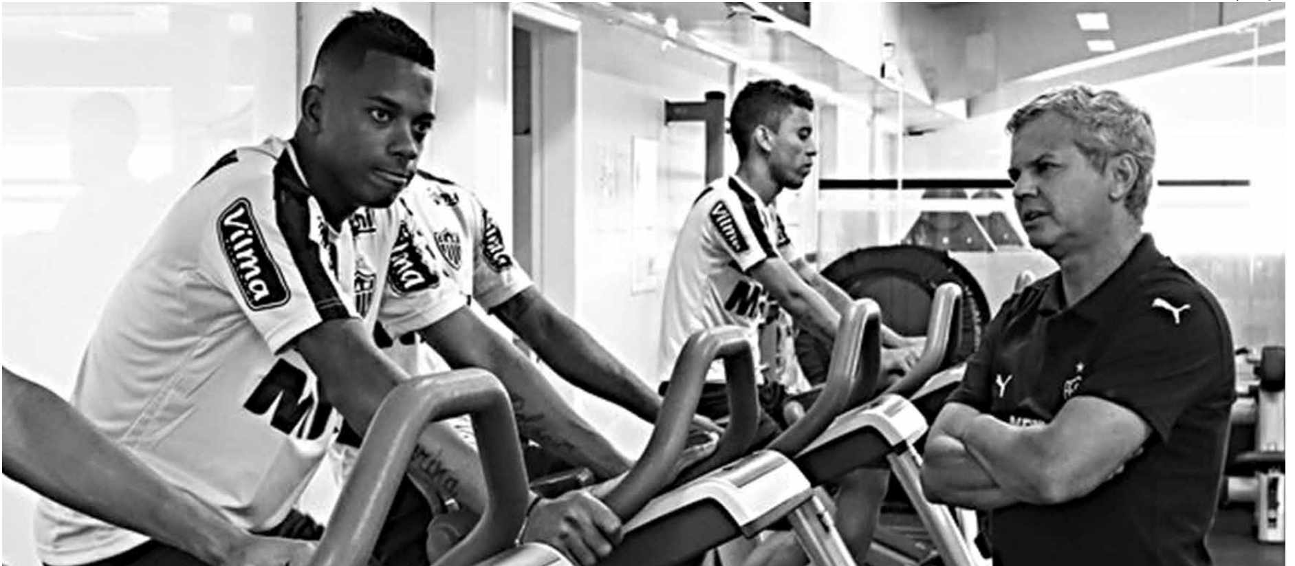
Robinho chegou ao Atlético Mineiro e foi logo para a sala de musculação se exercitar, depois para o gramado bater bola, antes de conceder entrevista à imprensa

- Meu objetivo é continuar jogando bem. Sei do esforço que o Atlético-MG fez para me contratar e espero fazer o meu melhor. Quero voltar a me preparar, estou em um grande clube, com grandes jogadores. Espero rapidamente me entrosar. Jogando bem no Galo, a possível volta para a Seleção é o meu objetivo, mas