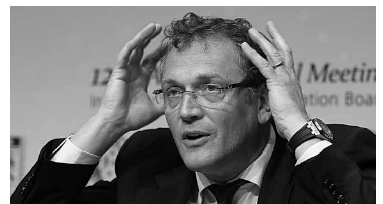
Ex-secretário causou um grande prejuízo aos cofres da Fifa

"Isto causou um prejuízo econômico considerável à Fifa, enquanto seus interesses privados e pessoais diminuíram sua capacidade para desempenhar com eficácia suas funções como secretário-geral", afirmou o Comitê de Ética.