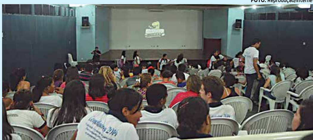
Registro de uma das atividades realizadas durante a segunda edição do evento, no ano passado

De acordo com o Regulamento do Festival, cada diretor ou realizador pode inscrever até, no máximo, dois filmes, produzidos entre os anos de 2013 e 2016, com tempo de duração de 5 e 20 minutos, vedando-se a participação de trabalhos que caracterizem promoção institucional e - ou então - empresarial. Pelos Correios, devem ser enviadas à organização do evento duas cópias em DVD, ou pendrive, da obra audiovisual, duas fotos digitalizadas do vídeo, uma foto do diretor em resolução mínima de 300dpi e, ainda, necessário se faz o preenchimen-