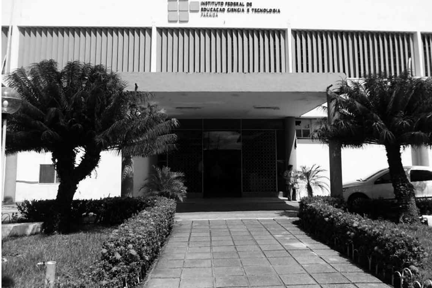
Instituto Federal da Paraíba disponibilizou a primeira chamada no site e os estudantes devem mostrar interesse entre os dias 12 e 17

Para os candidatos da UFCG, o local para realizar o cadastramento será na coordenação do curso para o qual foi classificado. Já na UFPB, os candidatos devem ir na Central de Aulas do Campus I, em João Pessoa. Em ambas, os horários para atendimento serão das 8h às 12h, e das 14h às 17h. Os documentos exigidos são: original e cópia autenticada