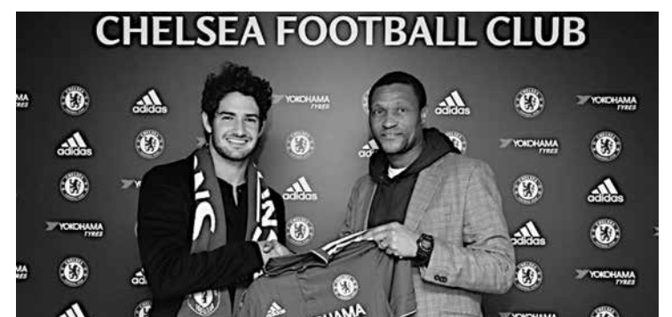
Alexandre Pato durante a sua apresentação na equipe inglesa

porada. Agora não é o momento de ele estrear. Ele está progredindo muito bem, mas vem de férias. É claro que você ainda vê diferença entre ele e os outros no treinamento por conta disso. Depois de dez dias, você pode ver progresso nele, mas ele vai para o próximo nível de treinamento na semana que vem."