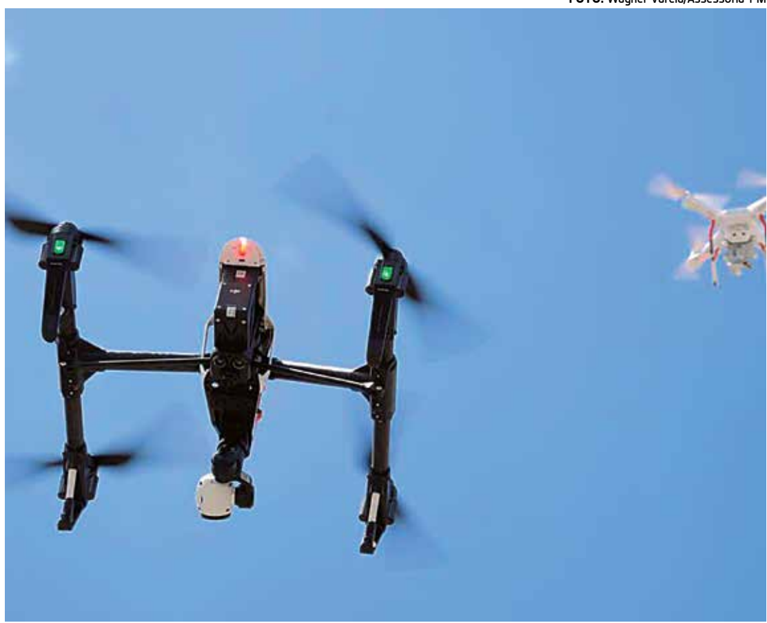
Os drones da Polícia Militar estão sendo fundamentais na localização dos criadouros do mosquito

A última fase do Plano da Defesa será desenvolvida em parceria com o Ministério da Educação, entre 19 de fevereiro e 4 de março, quando as escolas públicas serão visitadas por militares, ministrando palestras aos estudantes sobre a necessidade de combater o Aedes aegypti .