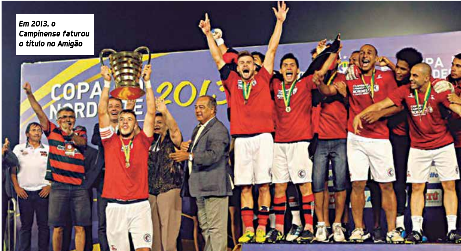
Em 2013, o Campinense faturou o título no Amigão

Pelo regulamento da disputa os times se enfrentam dentro dos grupos e turno e retorno, em seis rodadas. Os primeiros colocados de cada grupo e os três melhores segundos avançam para a etapa seguinte. Os duelos da segunda fase serão definidos por sorteio. Dentre os cinco classificados como líderes de suas chaves, os quatro melhores formam o Bloco I. O pior líder se junta aos segundos colocados no Bloco II. Cada time do Bloco I enfrenta um rival do Bloco II em duas partidas e faz o segundo jogo em casa. Os vencedores passam para as semifinais, também