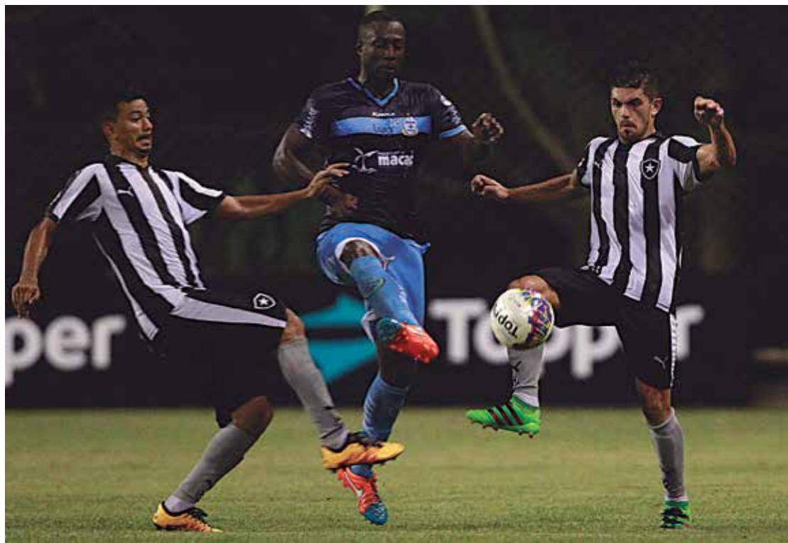
O Botafogo é o líder do Grupo B da Taça Guanabara com 100% de aproveitamento em três jogos