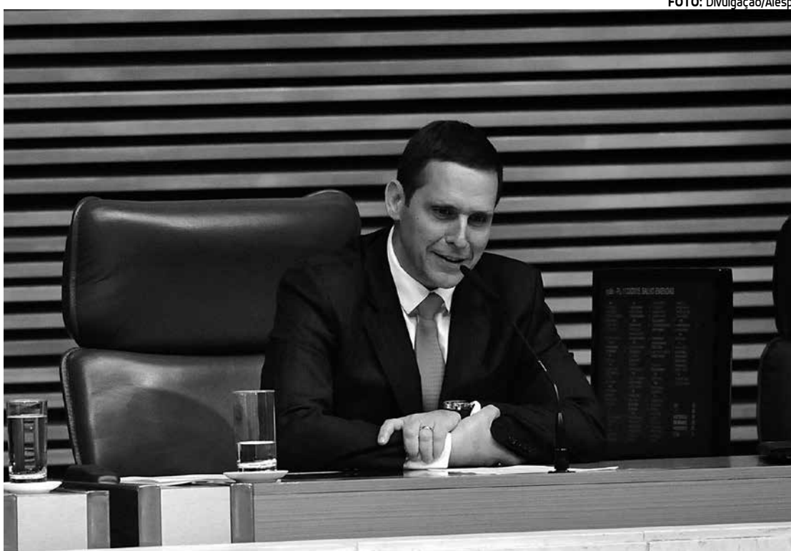
Presidente da Assembleia Legislativa de São Paulo é alvo de investigação da Operação Alba Branca

Capez disse ainda que conversou nessa quinta-feira, 11, com Alckmin e que o governador relatou estar "abisado" com as revelações da investigação que se aproxima de quadros do PSDB e de ex-integrantes do governo estadual. Na quinta, o governador afirmou à imprensa que "quem for culpado vai ser punido, independentemente de partido político", em refe-