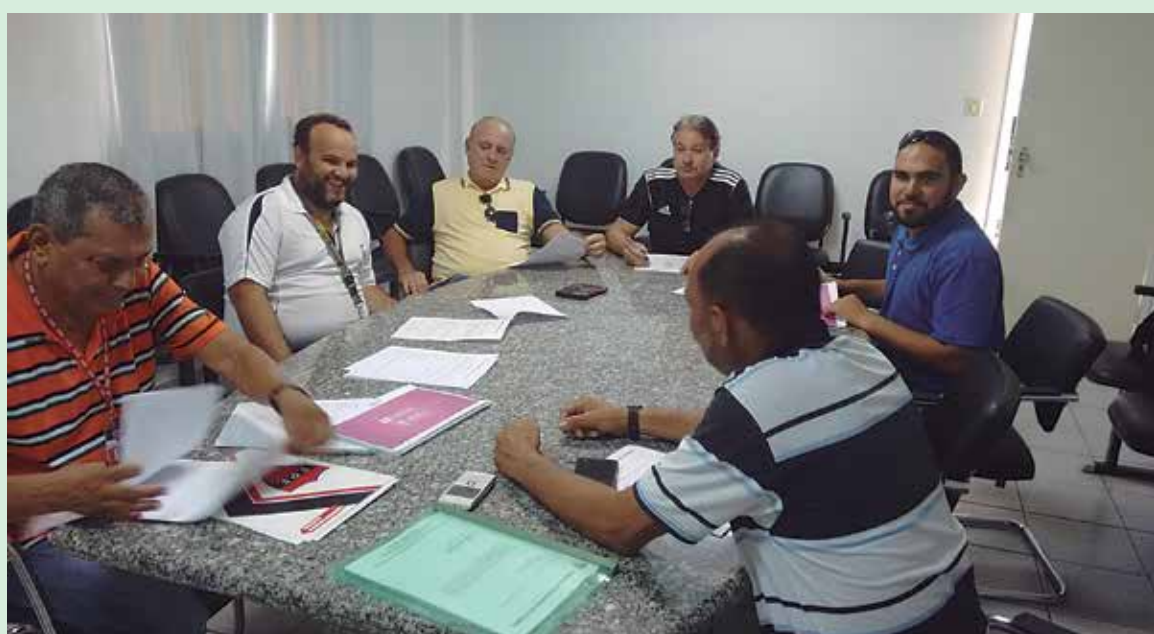
Cronistas esportivos e dirigentes da Federação debateram assuntos referentes a Copa do Nordeste

Nenhum repórter de rádio ou fotógrafo terá acesso ao gramado faltando menos de 30 minutos de começar o jogo quando cessa o credenciamento. A lista das pessoas foi enviada pela CBF e será observada amanhã. As empresas de comunicação tiveram até a última quinta-feira para relacionar suas equipes de cobertura para o jogo entre Botafogo e Sport diretamente com a CBF.